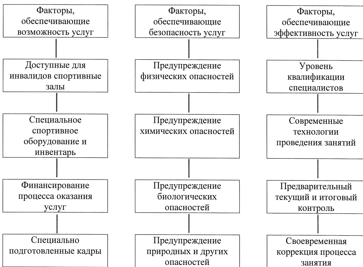
Рисунок 1. Факторы, влияющие на доступность услуг для инвалидов и других маломобильных групп населения на объектах спорта и в учреждениях и организациях, предоставляющих услуги

Понятно, что для обеспечения возможности предоставления и получения услуг для инвалидов и МГН необходимо наличие кадров, имеющих право работать с данным контингентом.